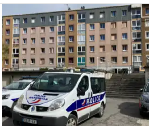
Hautes-Alpes : une opération « place nette » menée à Briançon