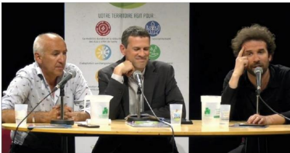
Animé depuis le Théâtre du Briançonnais, le débat a été retransmis et partagé par 36 communes en simultané.

Après la projection du film de Cyril Dion, « Après-demain », le débat a mobilisé les esprits, sous l'égide du réalisateur et de Pierre Leroy, le président du territoire. Et les citoyens ont pris le sujet à bras-le-corps, avec plus de 600 personnes réunies sur les différents sites où était animée la soirée, plus d'une centaine de questions soulevées, et déjà des milliers de vues en ligne. Au cœur des préoccupations : le transport. « On ne compte plus les citoyens qui mènent leurs propres initiatives, qu'il s'agisse de leur gestion des déchets, de leur chauffage ou de leur manière de consommer. Le point crucial de la soirée a tourné autour du transport, car ici, les citoyens se sentent concernés. La question est donc : »