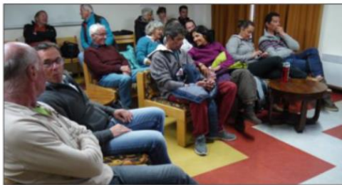
La projection a eu lieu dans une salle du village vacances Les Esquirousses, équipée d'un téléviseur, d'un accès à Internet et d'un grand écran.

Le Queyras est déjà très sensibilisé aux efforts climatiques. Durant l'apéritif dînatoire apporté par les habitants, il a été question, entre autres,