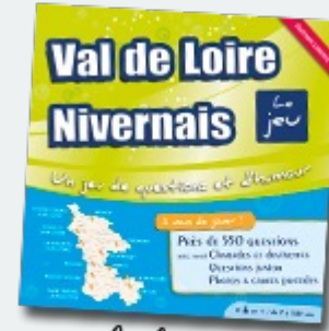
Val de Loire Nivernais