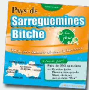
Pays de Sarreguemines Bitche