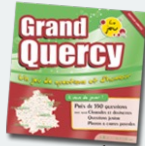
Le jeu du Grand Quercy