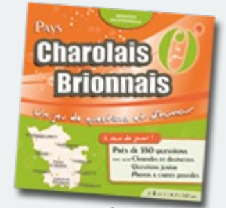
Pays Charolais Brionnais