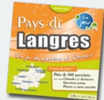
Pays de Langres