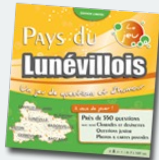
Pays du Lunévillois