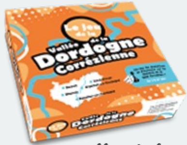
Pays Vallée de la Dordogne Corrèzienne